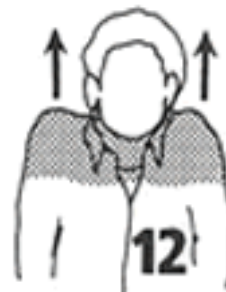
5 segundos dos veces

Escribir en el siguiente cuadro los diferentes instrumentos culturales de Colombia.