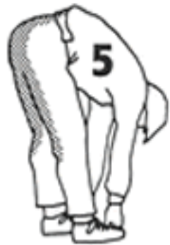
10 - 15 segundos