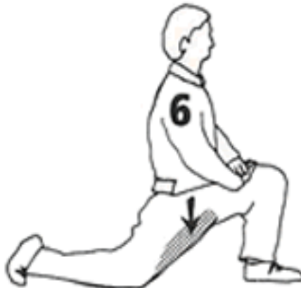
10 segundos cada pierna