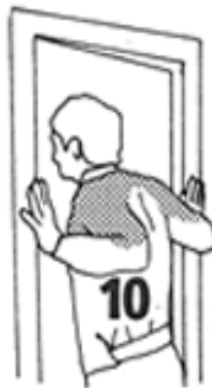
10 - 20 segundos