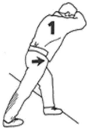
20-30 segundos cada pierna