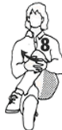
10 - 15 segundos cada lado