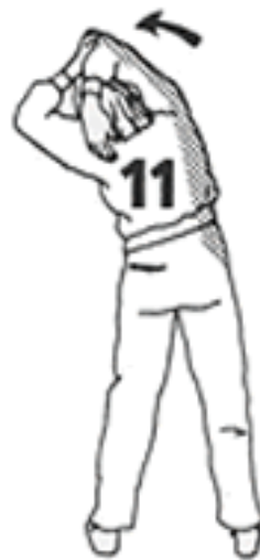
8 - 10 segundos cada lado