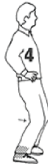
20 - 30 segundos