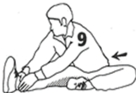
10 - 15 segundos cada pierna