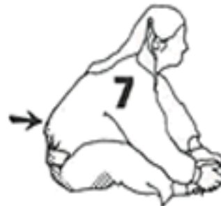
10 - 15 segundos