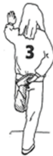
10 - 15 segundos cada pierna